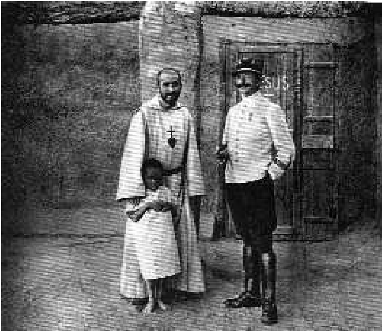
Devant l'ermitage à Taghit, le père de Foucauld et le capitaine de Susbielle

dans la conquête du Sahara occidental et El Mouggar devient à deux reprises un haut lieu des légionnaires. C'est une petite oasis de la vallée de la Zousfana au Sud-Sud-Est de Béchar qui est tenue par la dissidence et qui constitue une menace importante pour les colonnes françaises et ses postes plus au sud.