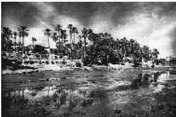
La vallée de la Zousfana à El Mouggar