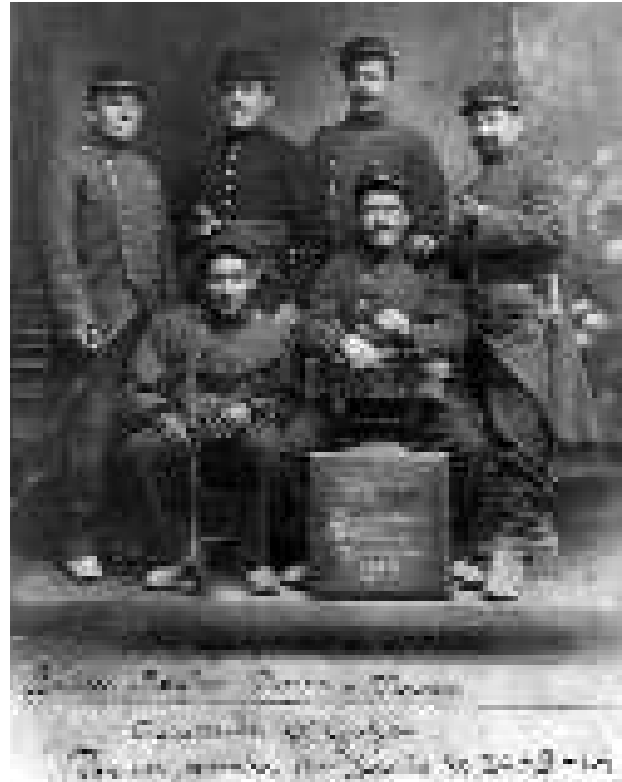
Légionnaires italiens engagés au 1er RE en 1914

Longue vie à l'Ancien qui reçoit régulièrement les journalistes venus du monde entier. Peut-être décou-