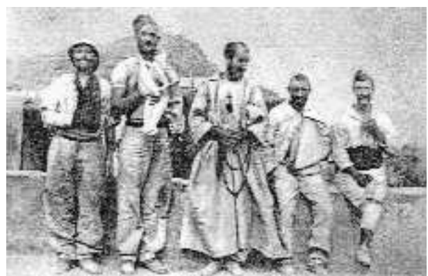
le père de Foucauld à Taghit avec les blessés d'El Mouggar

Au soir du combat, le bilan est très lourd, ne sont indemnes que 2 caporaux et 28 légionnaires qui rejoignent avec les blessés le poste de Taghit à une dizaine de km. Les morts sont inhumés sur place. Trois jours après, la compagnie montée compte 2 officiers, 2 sous officiers, 32 caporaux et légionnaires tués au combat ou morts des suites des blessures reçues; 5 Sous officiers et 42 caporaux et légionnaires sont blessés.