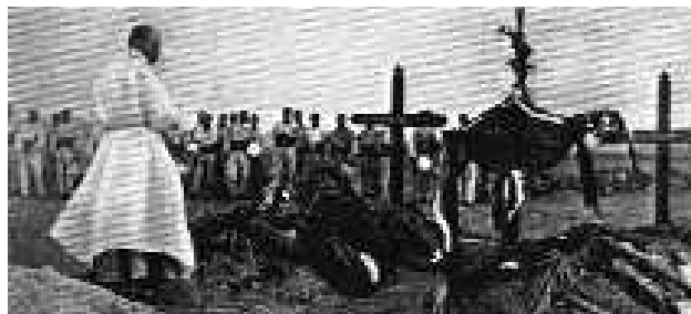
Le père de Foucauld à El Moungar bénissant la fosse où reposent les corps

Sources : Bibliographique : dossier " Conquête du Sahara " aux Archives du Ministère de la Défense, château de Vincennes et ouvrage " Charles de Foucauld " par l'abbé Georges Gorrée aux